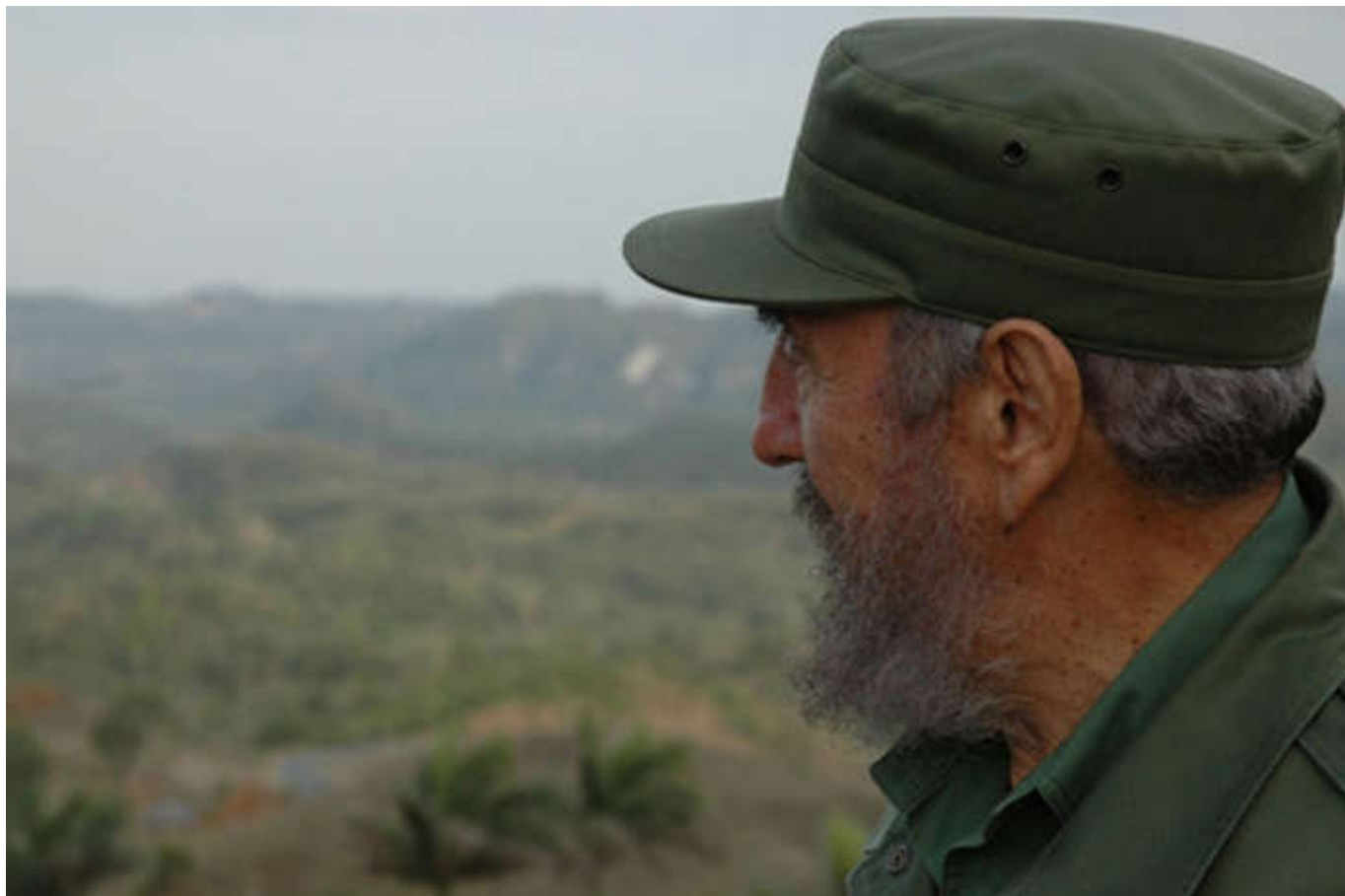
Fidel Castro en Pinar del Río

A lo anterior se suman cuatro hoteles y se proyectan otras iniciativas estatales para ampliar la capacidad de hospedaje en uno de los 25 destinos turísticos, del mundo, recomendado por la publicación británica Business Insider en 2018.