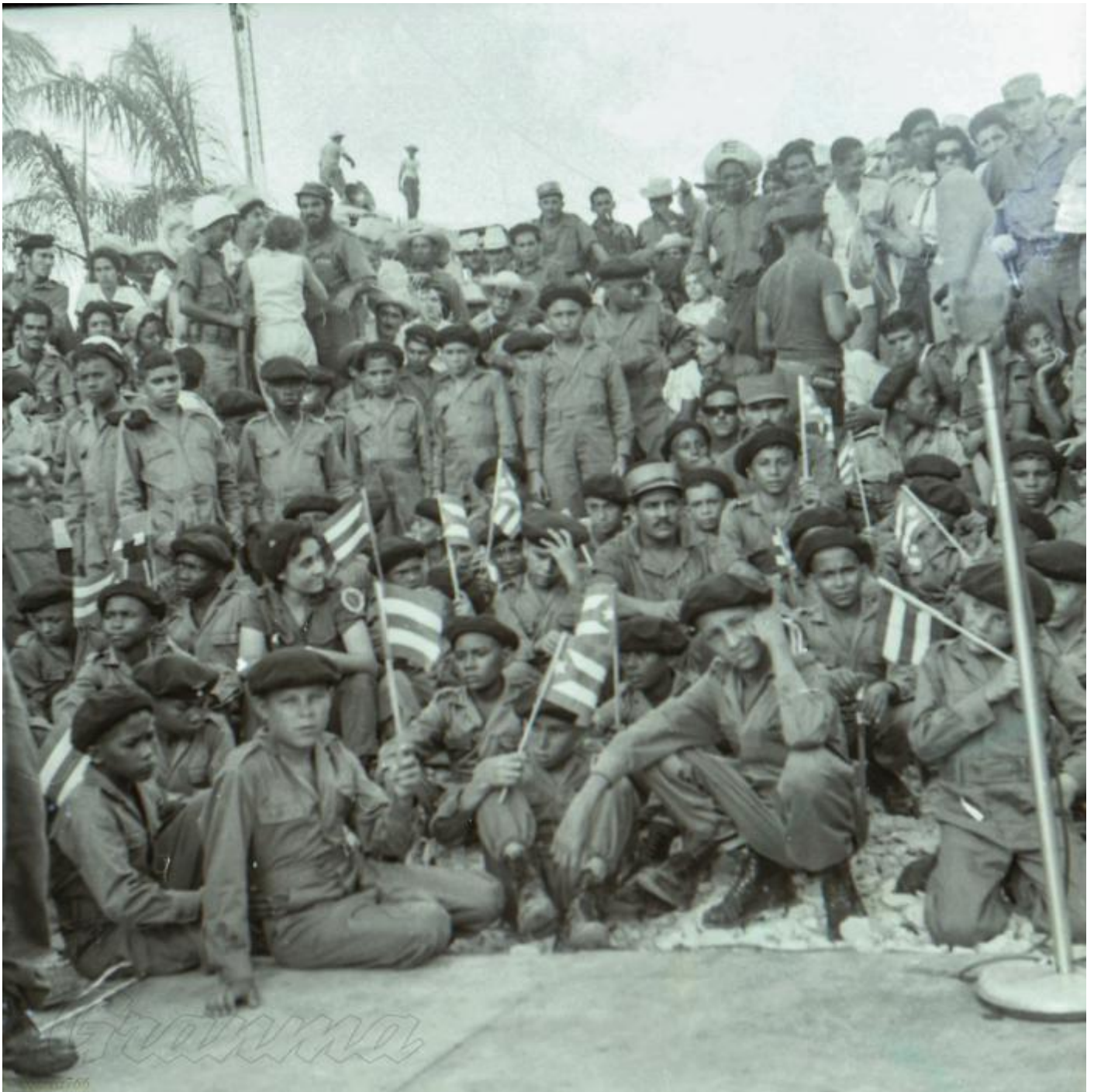
Un grupo de alumnos campesinos de la Ciudad Escolar Camilo Cienfuegos en Las Mercedes.