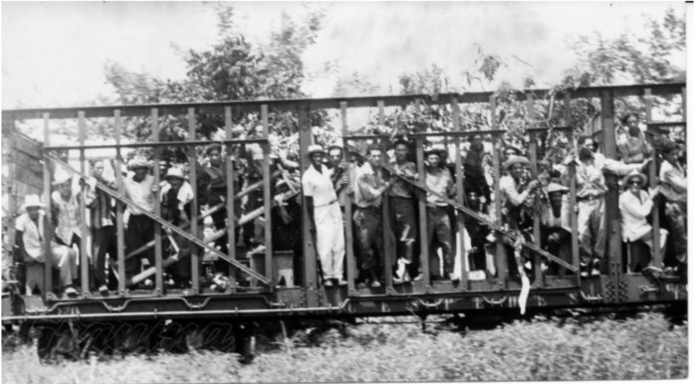
Vagones para el transporte de caña por ferrocarril, también fueron utilizados para llegar a Las Mercedes.