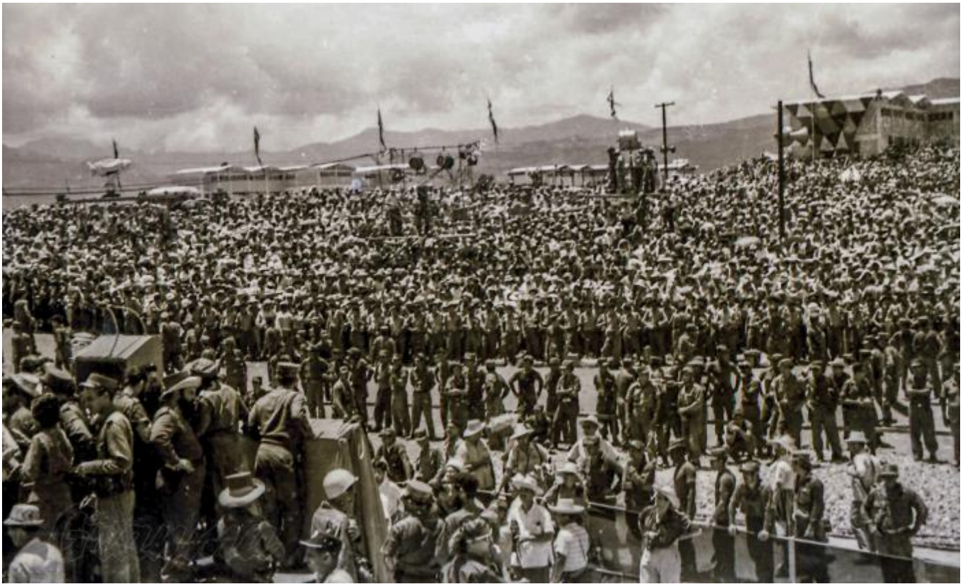
Más de un millón de personas participaron en la concentración el 26 de Julio en Las Mercedes.