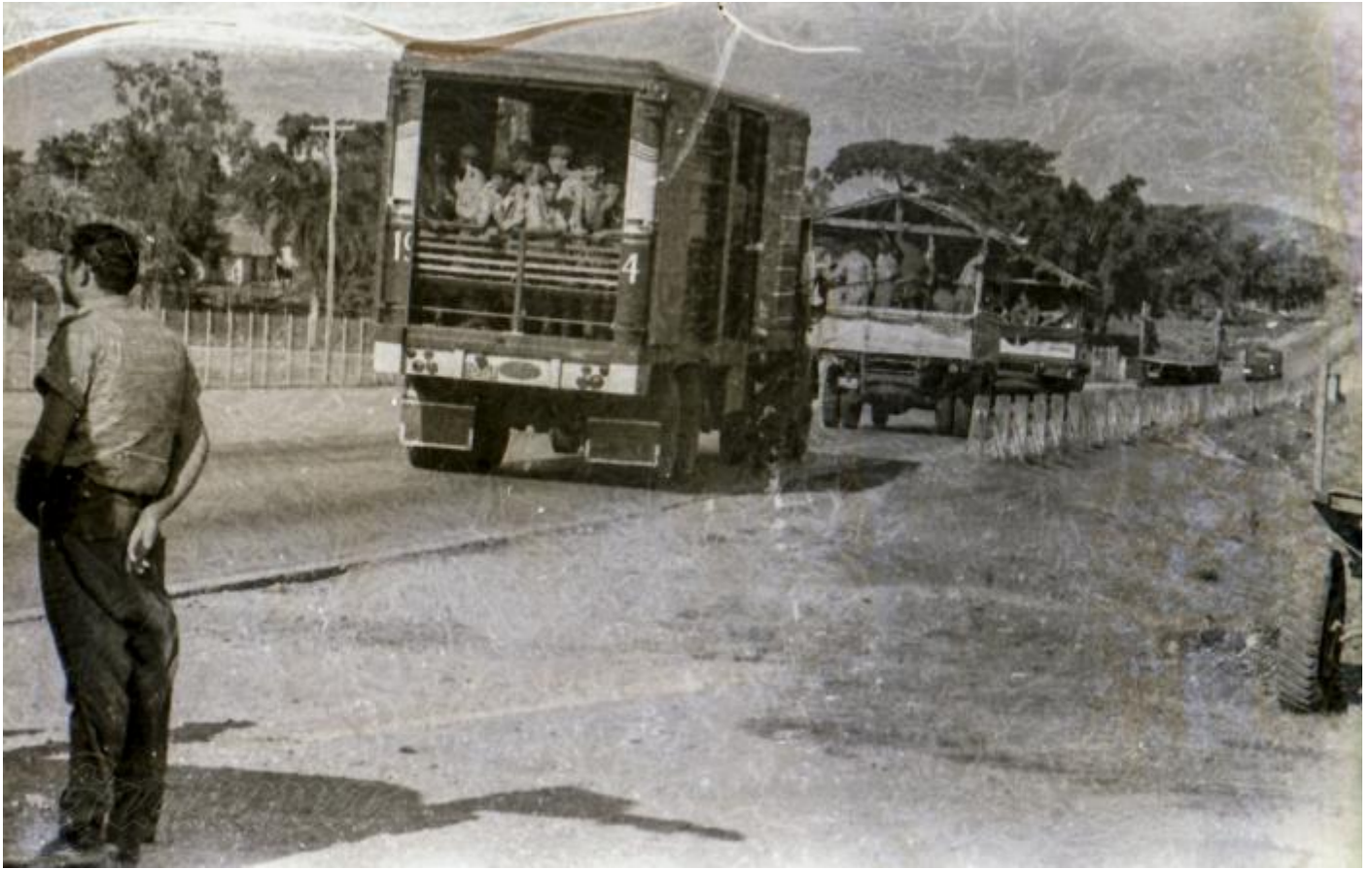
Una caravana con más de 500 camiones con obreros azucareros salió el 22 de Guanajay para ir recogiendo trabajadores concentrados en otras ciudades.