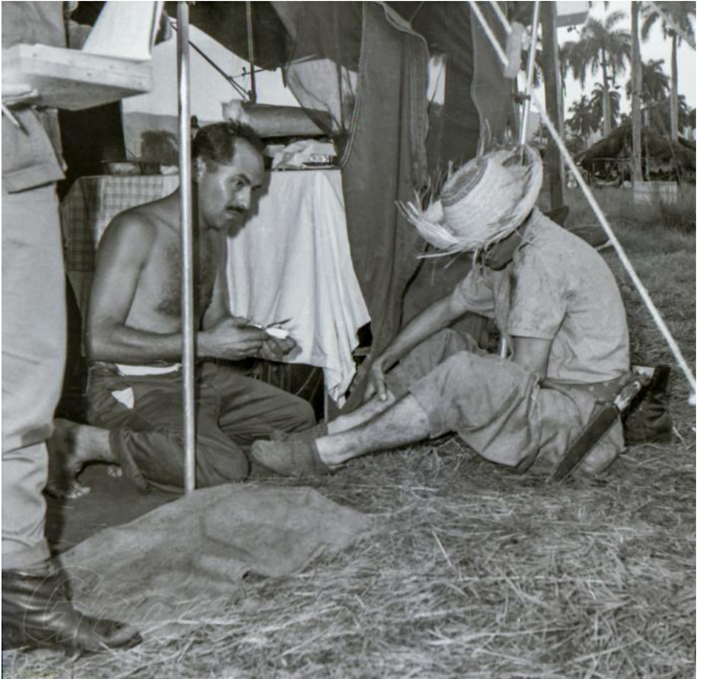
Un médico atiende a un visitante habanero que ha sufrido un ligero accidente en uno de los campamentos habilitados al efecto.