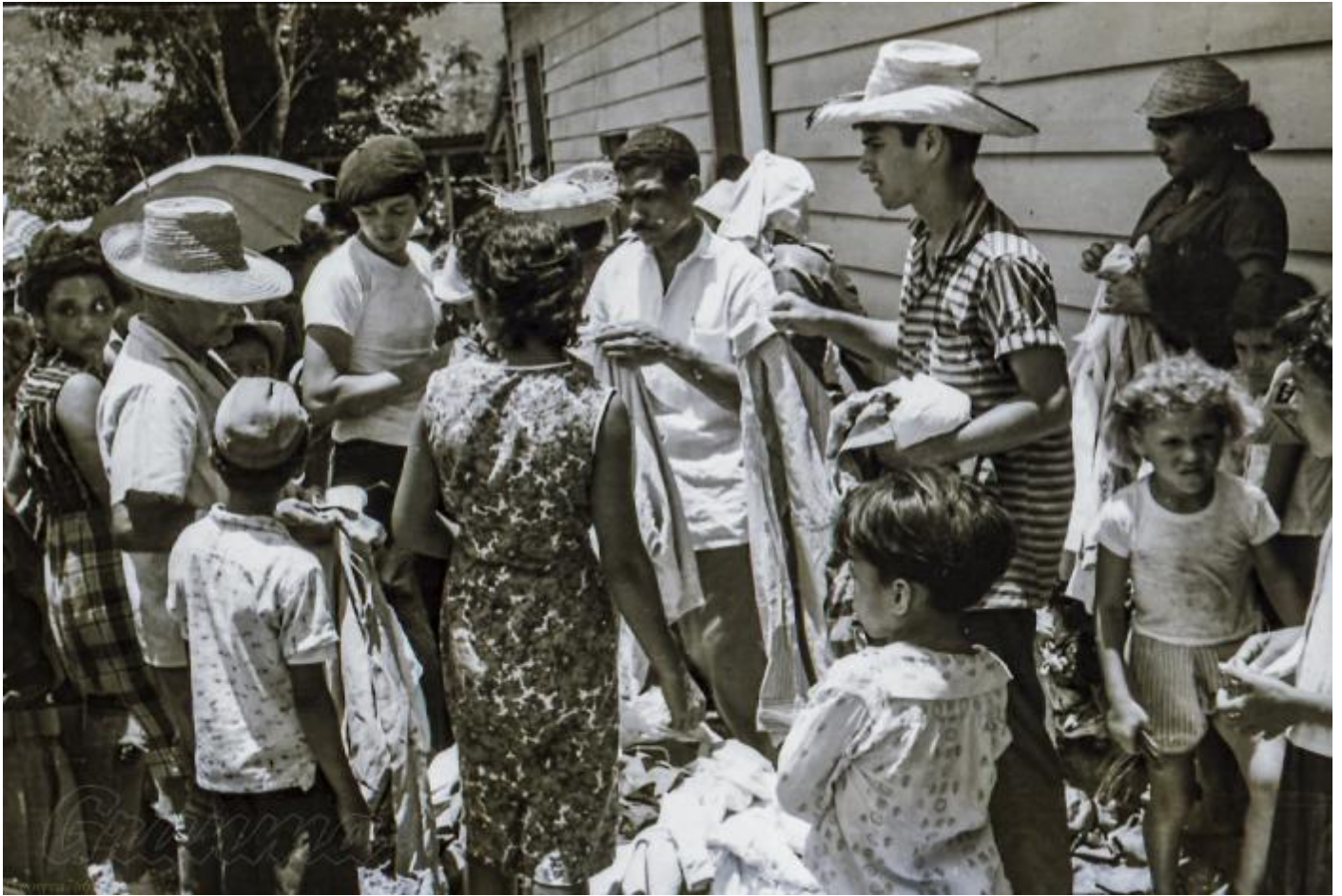
Campeños recibiendo ropas que fueron donadas por varias organizaciones revolucionarias.