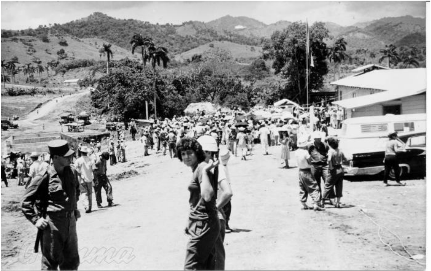
Luego de caminar un buen trecho bajo el ardiente sol, ya falta poco para llegar a Las Mercedes.