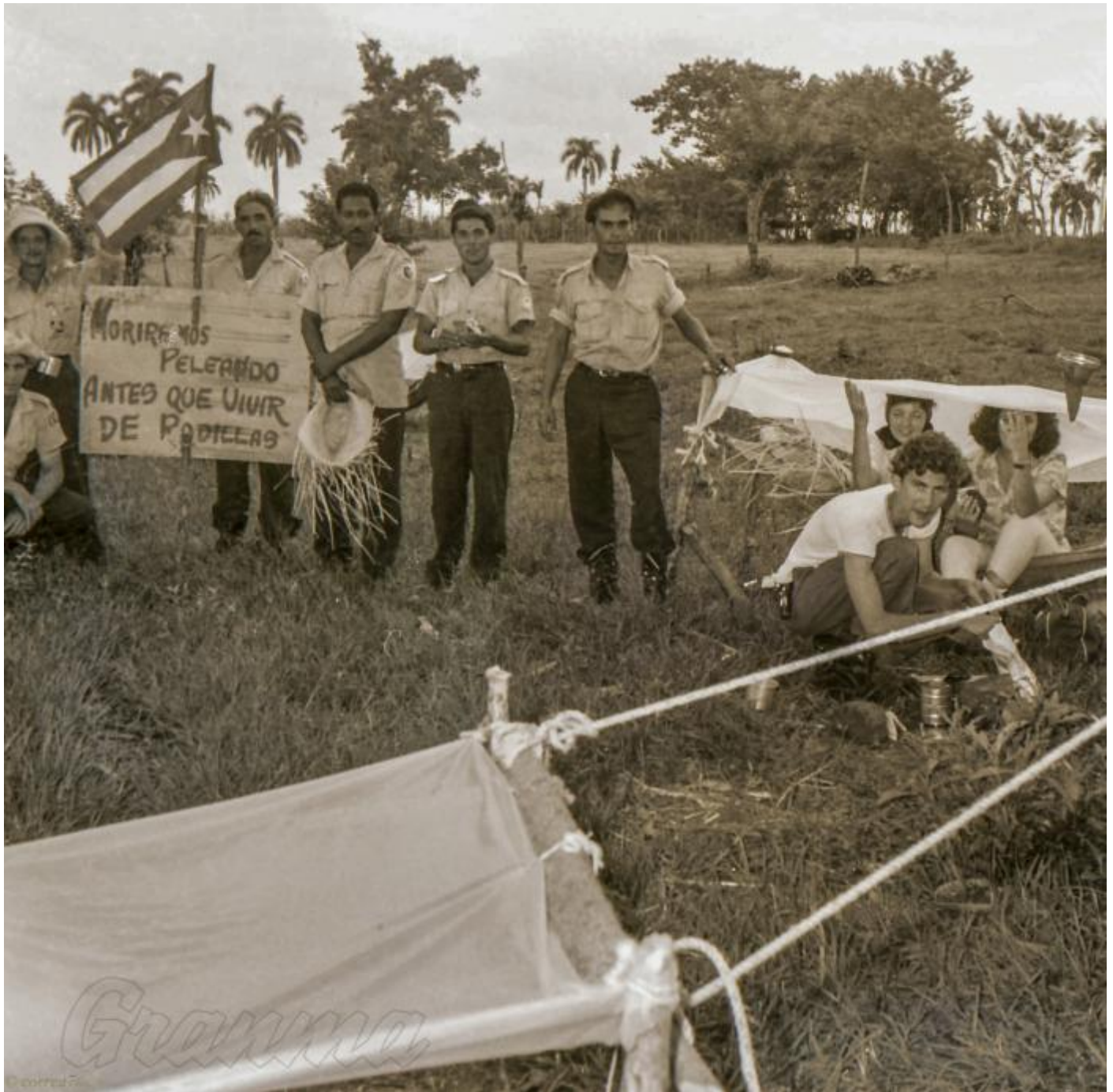
Caravanistas en su improvisado campamento.