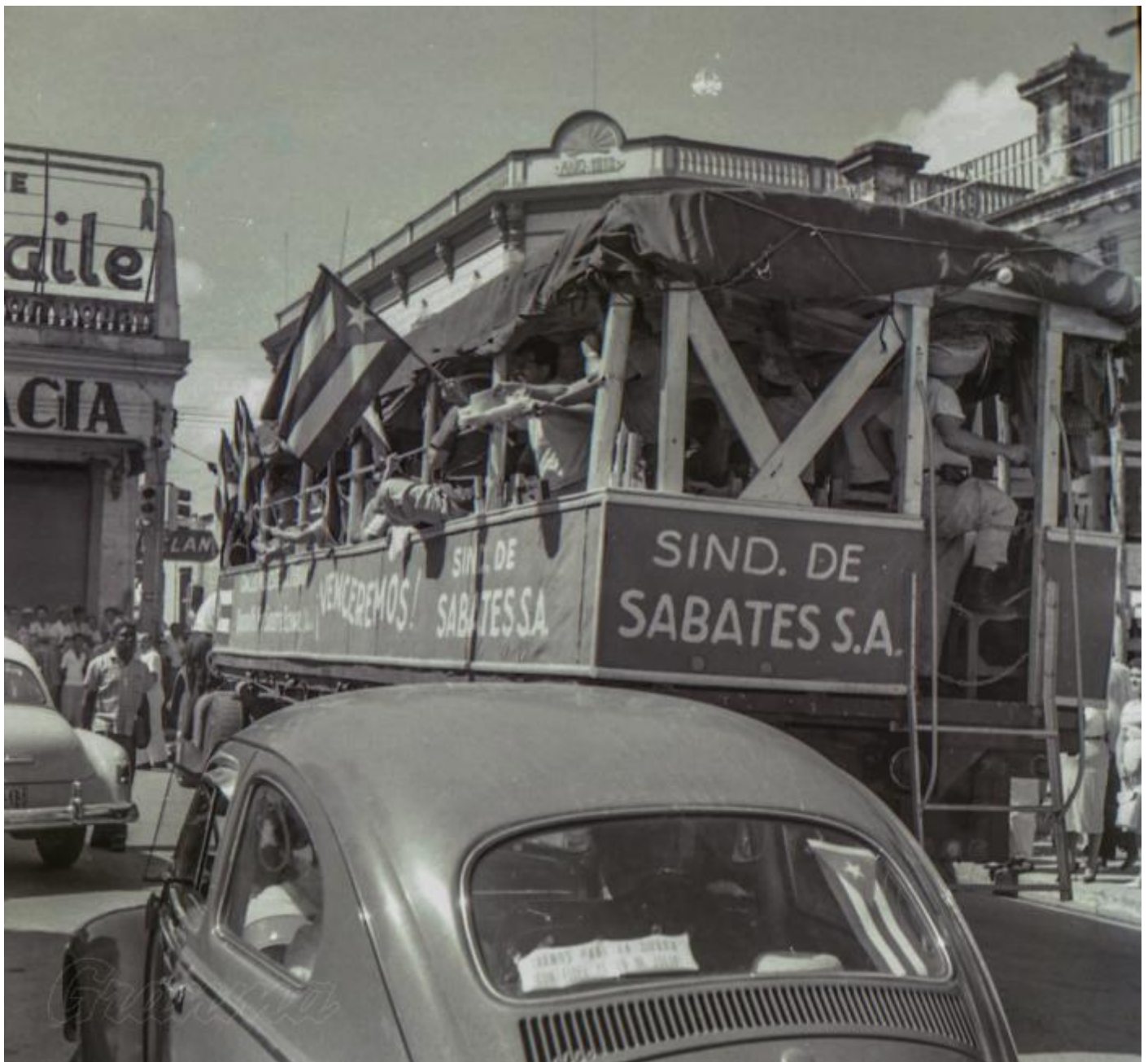
Centenares de camiones, ómnibus y autos se desplazaban en caravanas cruzando por pueblos y ciudades rumbo a Las Mercedes.