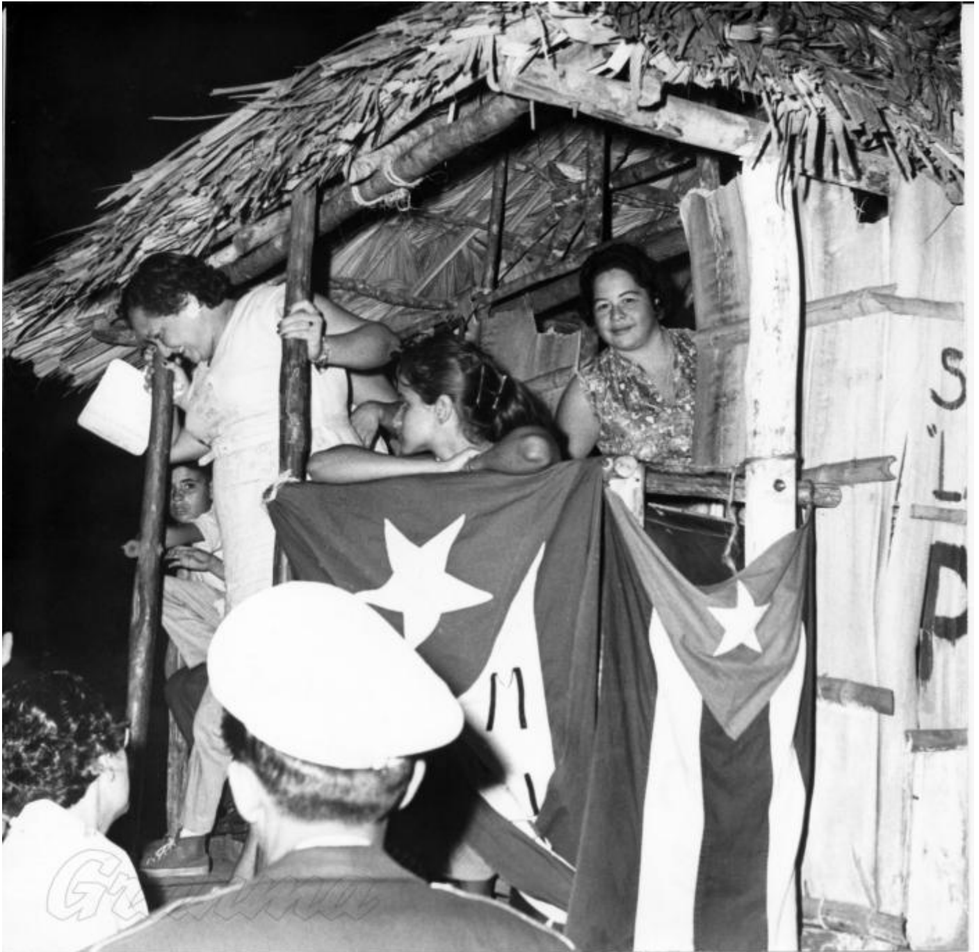
Este camión lo convirtieron en un verdadero bohío rodante.