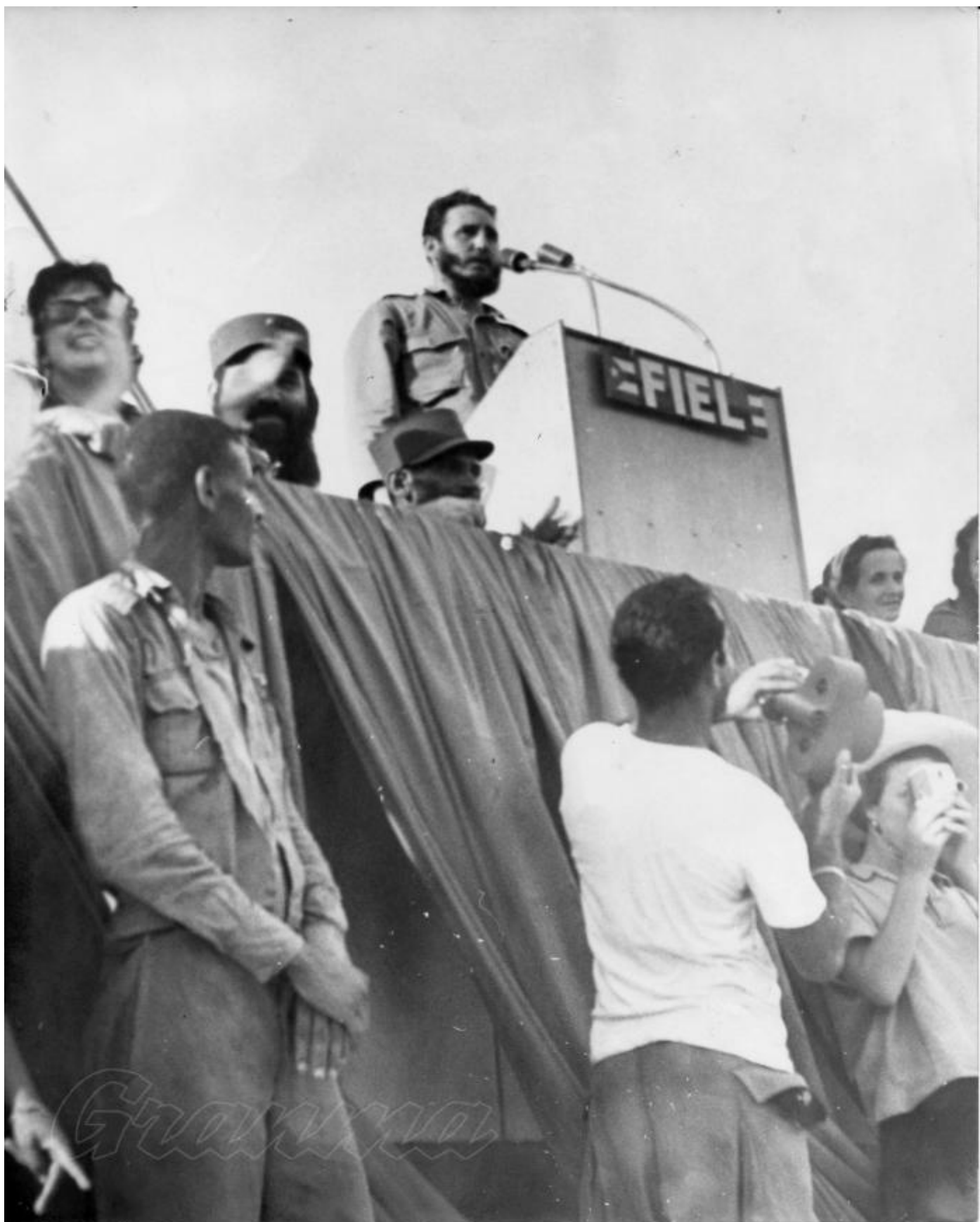
Fidel hizo el resumen del acto ante una multitud de más de un millón de personas.