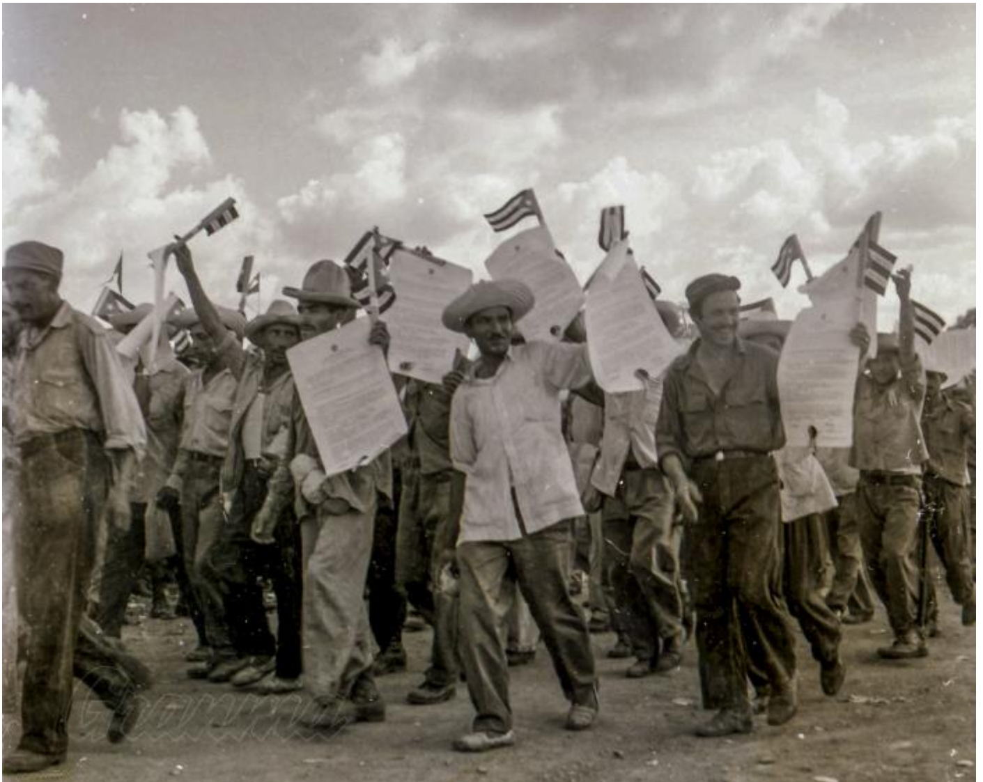
Desfilan un grupo de campesinos mostrando sus títulos de propiedad de la tierra