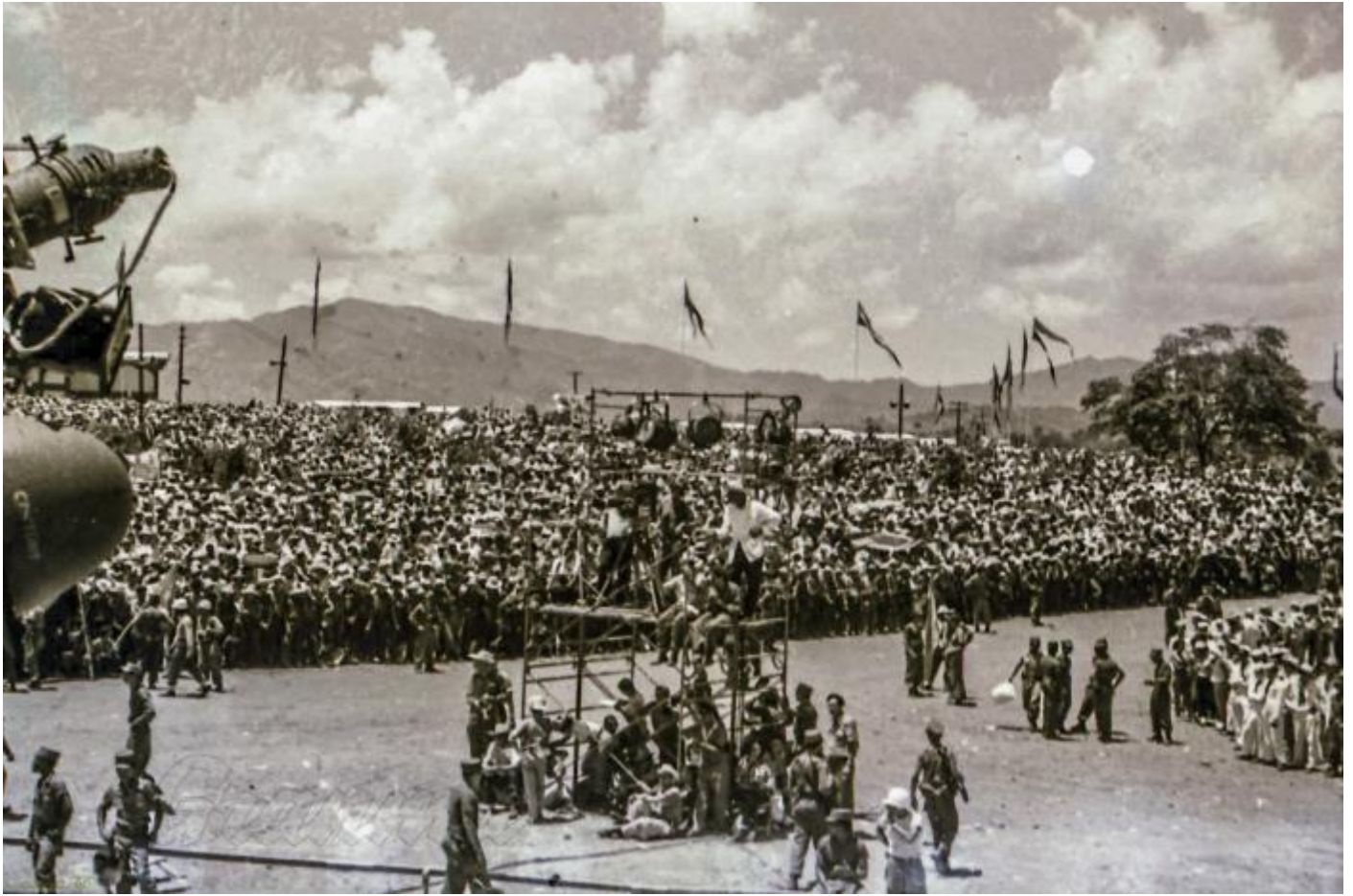
Vista panorámica de Las Mercedes, donde se efectuó la gigantesca concentración.