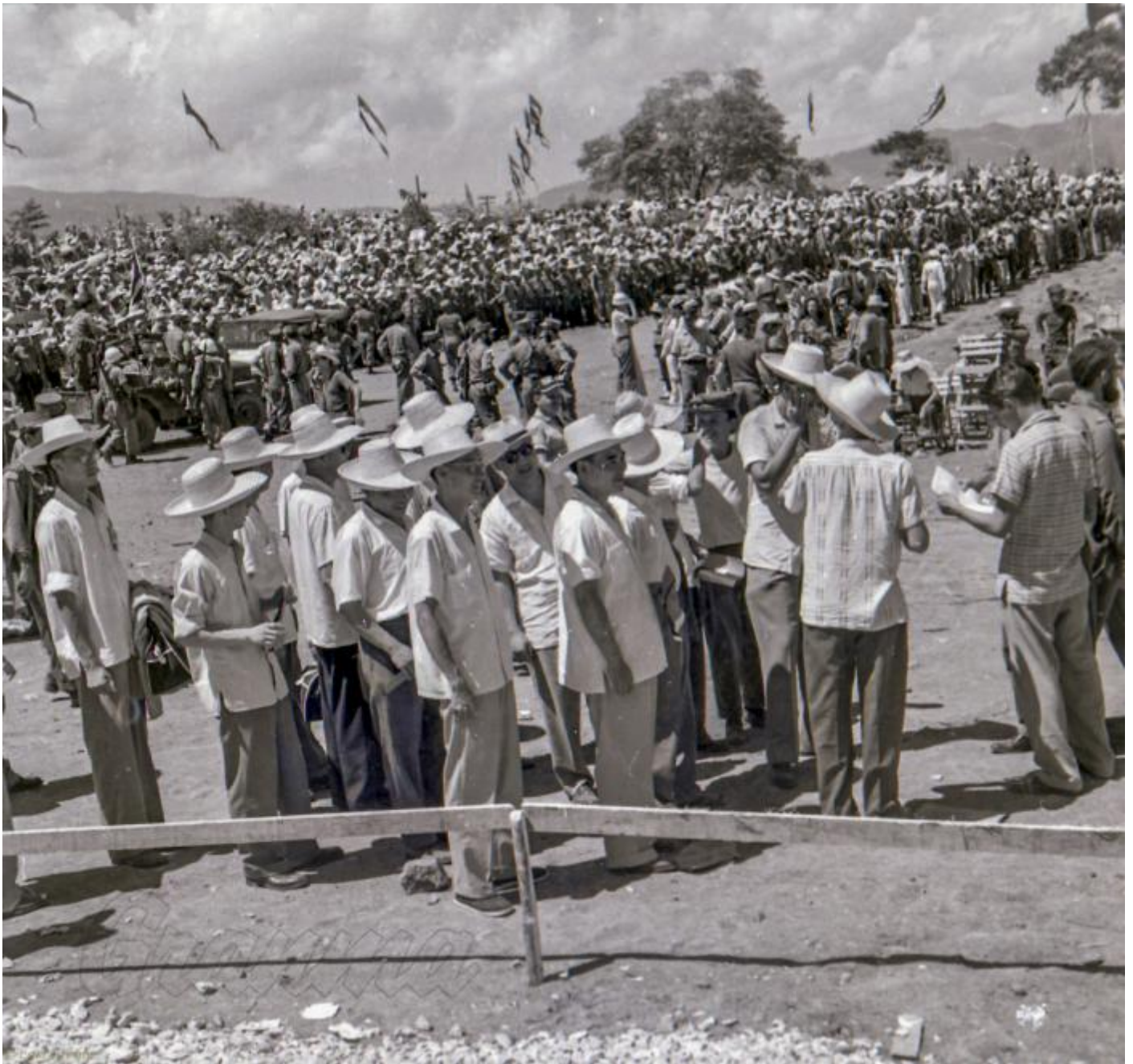
Invitados extranjeros arriban a Las Mercedes.