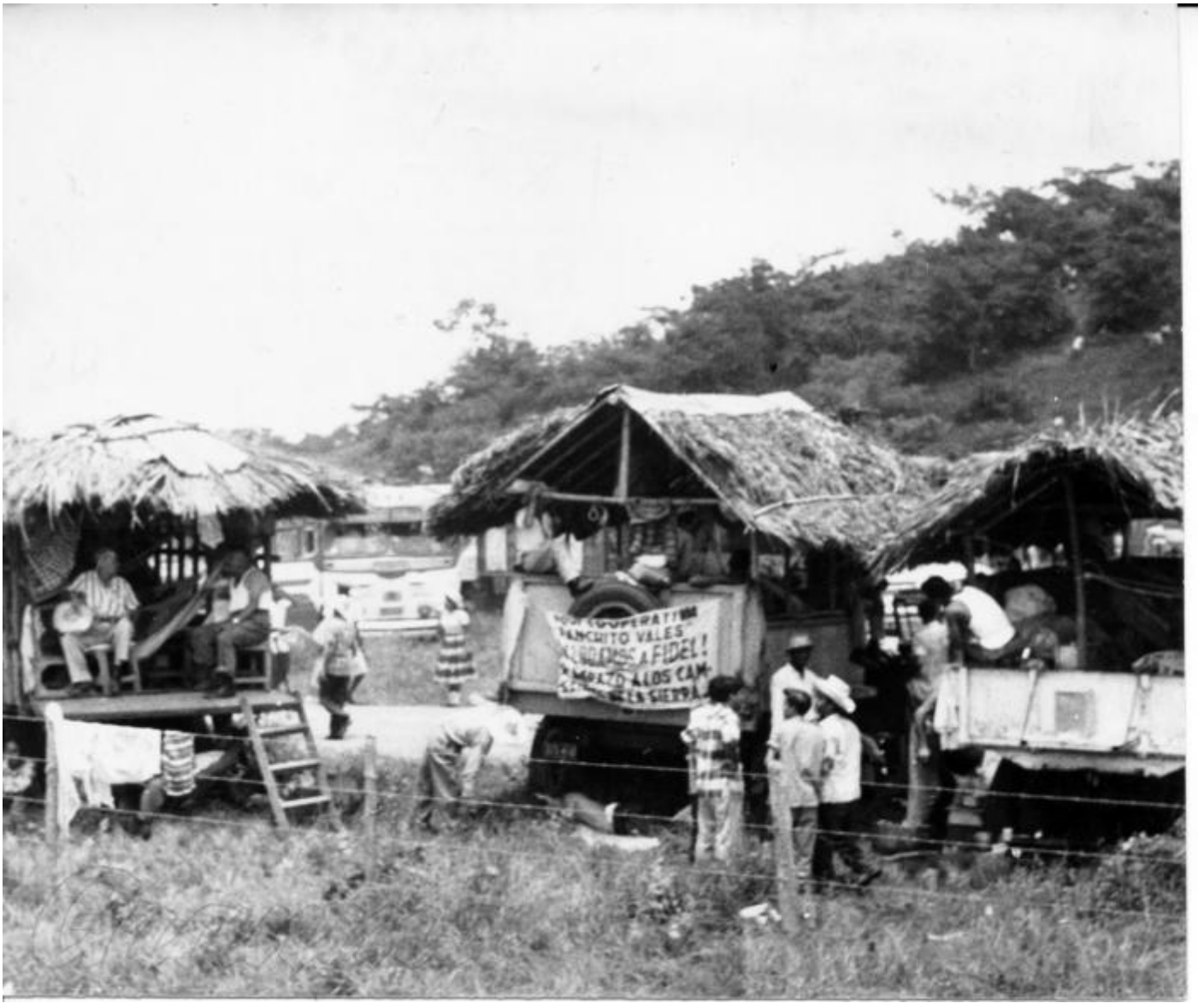
Algunos camiones fueron cubiertos con un techo de guano para protegerse de la lluvia y el sol.